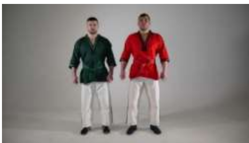
Рис. 2 Форма участников соревнований