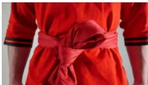
Рис. 3 Завязанный пояс

12.6. Защитные средства (эластичный бандаж, повязки) используются по желанию участников и не должны представлять опасности для здоровья участников.