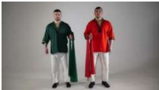
Рис. 1 Форма участников соревнований

12.5. Специальная спортивная обувь (борцовки).